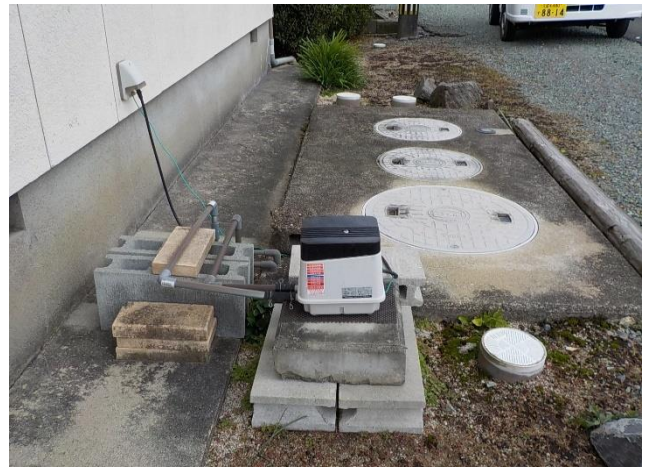
ブロワーを移動した様子

夜中にブーンという音が響くようでしたら、ブロワーの振動が、建物の基礎コンクリートから、共振を起こして伝わっていることが考えられます。ブロワーの位置を離して、土の上に置くことで、音が抑えられる場合があります。