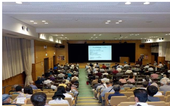
10月5日講習会の様子

新規簡易チェック制度（減額制度）ご希望の方は、講習会終了後に、説明をおこないます。時間は20分程度を予定しております。